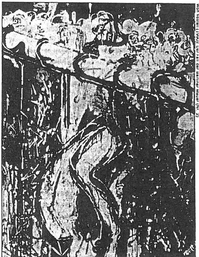
W. VOSTELL (1940): DER FALL DER BERLINER MAUER (Nr. 2)

W. Vostell hat den dramatischen Prozeß in die Gestalt eines Bildes übersetzt, das die seelischen Wirksamkeiten heraushebt, die hier eine Rolle spielen. Er zeigt, wieviele Augen durch die Mauer dringen; er macht sichtbar, wie ein Bein durch die Mauer geht; er zeigt einen Zug von Eßlöffeln, der sich über die Mauer bewegt. Hier wird die Mauer selber zum Bild, mit einer Dramatik von Widerstand und Durchdringen. Das sagt uns, was vor zwei Jahren passiert ist; Psychologisch Übersetzen sucht, dem nahezukommen.